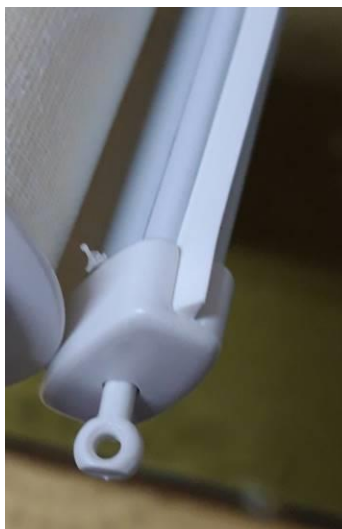
Рис. Боковая направляющая лески