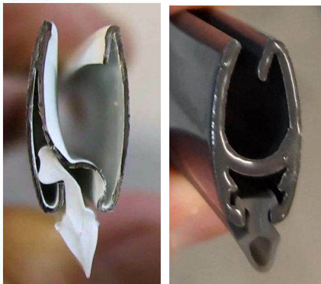
Рис. Вставка уплотнителя в нижнюю планку

Вставить уплотнитель в нижнюю планку, как показано на рисунке.