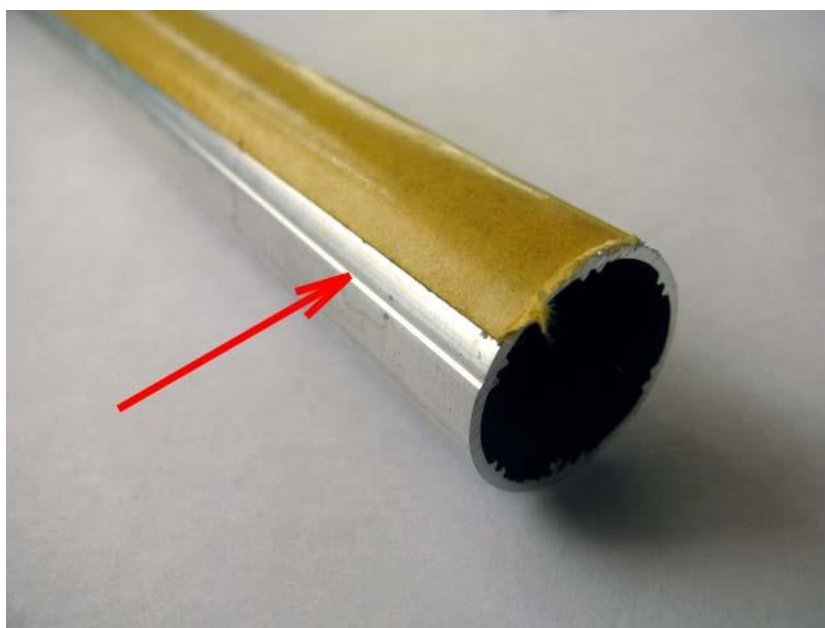
Рис. Наклеивание клейкой ленты на трубу

Наклеить ленту клейкую 12 мм на верхнюю трубу \varnothing 19 мм вдоль продольного паза.