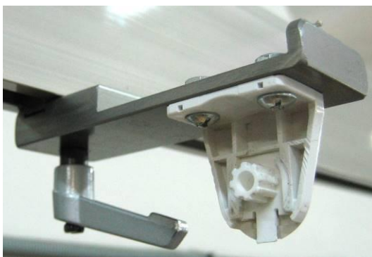
Рис. Кронштейн MINI для подъемника

Готовое изделие повесить на специальный подъемник. Вариант кронштейна для подъемника показан ниже.