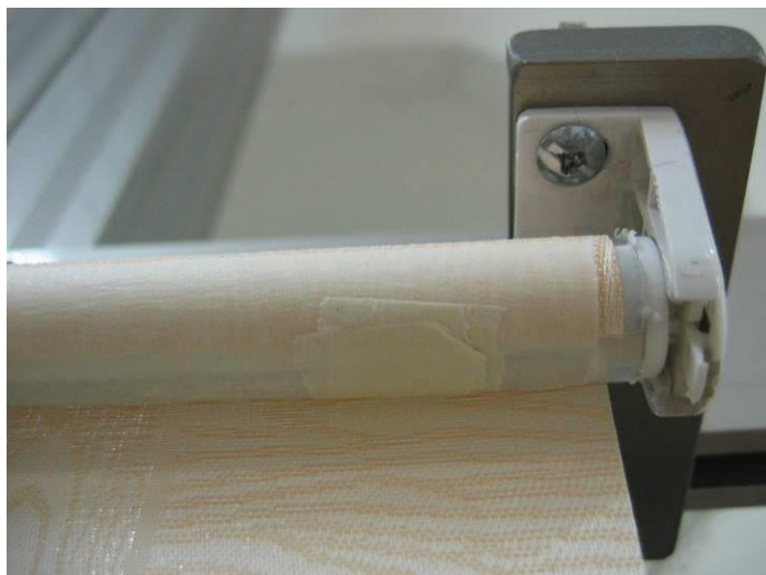
Рис. Выравнивание ткани путем наклеивания скотча