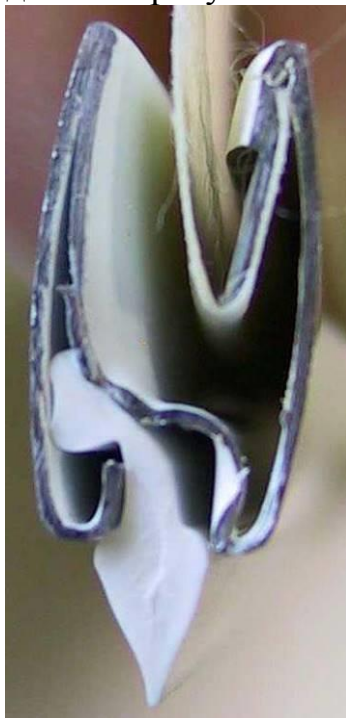
Рис. Нижняя планка в сборе

Вставить ткань в нижнюю планку как показано на рисунке ниже. Лицевая сторона ткани находится на рисунке слева.