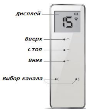
Пульт 15-канальный DC1702