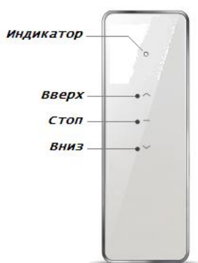
Пульт 1-канальный DC1700