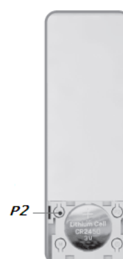
Кнопка настройки «P2» и отсек для батареи