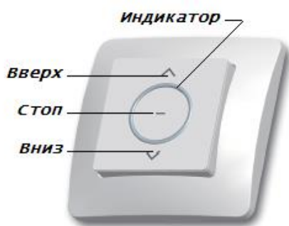
Радиовыключатель 1-канальный DC315