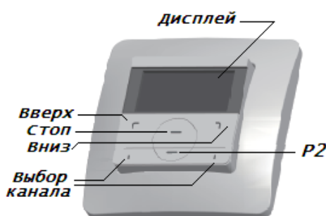
Радиовыключатель 15-канальный DC317