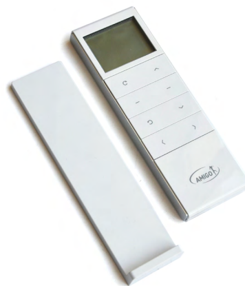
Пульт 15-канальный для ВЖ SMART DUO DD1612P 800426-0000