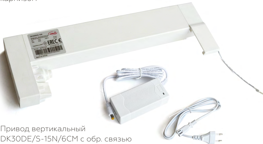
Привод вертикальный DK30DE/S-15N/6CM с обр. связью 800350-0000